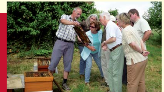
Von der Biene ins Honigglas, Gerhard Heil