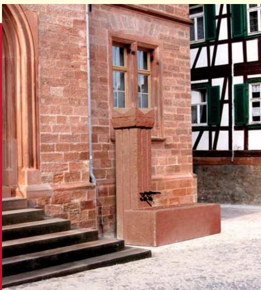
Rathausplatz mit Brunnenmodell

Wenn Sie, Ihr Verein, Ihre Gruppe die Einweihungsfeier aktiv mitgestalten möchten sprechen Sie uns bitte an. Wir freuen uns darauf!